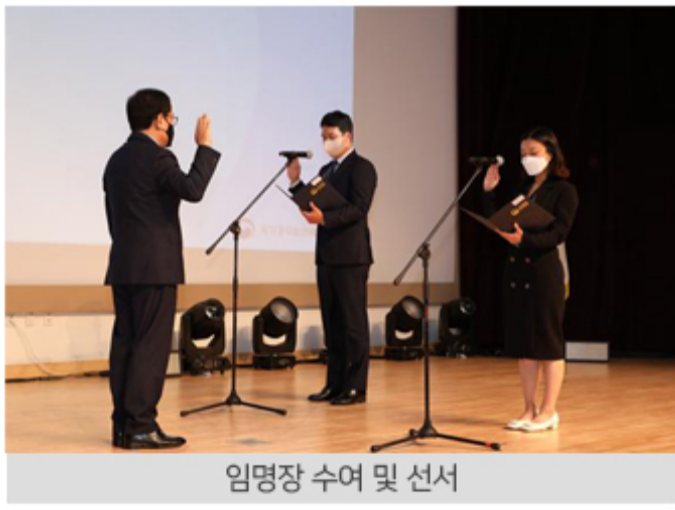
임명장 수여 및 선서