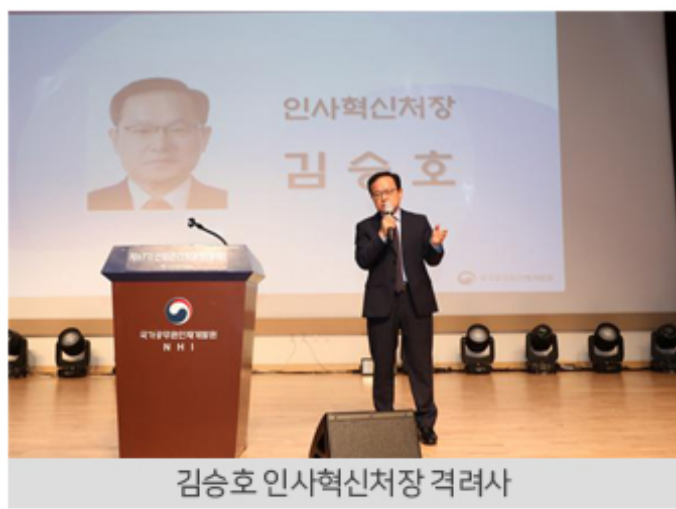
김승호 인사혁신처장 격려사

□ 수료식에 참석한 김승호 인사혁신처장은 “끝없는 잠재력을 가진 예비 사무관들이 앞으로 공직에서 일으킬 변화와 혁신이 무척 기대되고 설렌다”면서 “대한민국의 미래를 위해 모두 사명감을 가지고 최선을 다해 임해주시길 바란다”고 말했다.